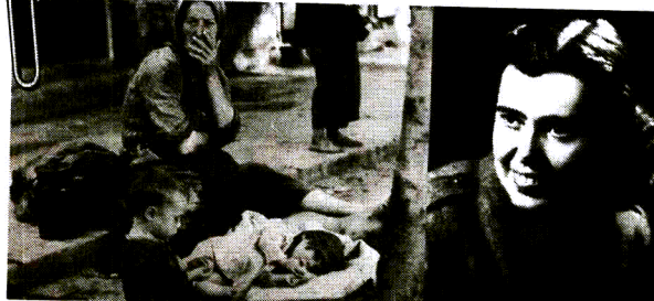
“ ELVIRA KOHN prva je ratna fotoreporterka koja je radila od 1943. do 1945. godine