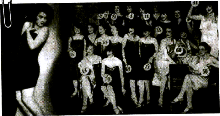
“ ŠTEFICA VIDAČIĆ bila je prva Miss Jugoslavije i Miss Europe 1927. godine u izboru Fanameta