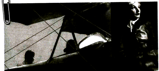
“ KATARINA MATANOVIĆ prva je hrvatska avijatičarka koja je položila pilotski ispit

Peticijom za obilježavanje uspomene na zaslužne Zagrepčanke građani su pokazali da im se ideja sviđa. Stoga će se potpisati i dalje prikupljati u Knjžnici Bogdana Ogrizovića u Preradovićevoj ulici 5.