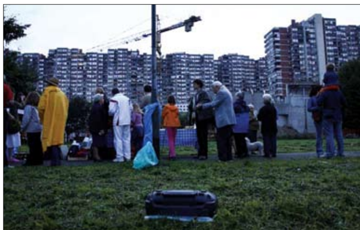
Otvoritev UrbanFestivala na travniku pred objektom Mamutice

Kolektiv KUD C3 je na treh lokacijah v centru Zagreba postavil instalacijo Čakalnice zavzetja. Skozi projekt se avtorji sprašujejo o kapitalističnem privajanju javne-