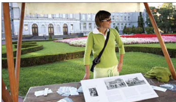
Stojnica projekta Ženski vodič skozi Zagreb