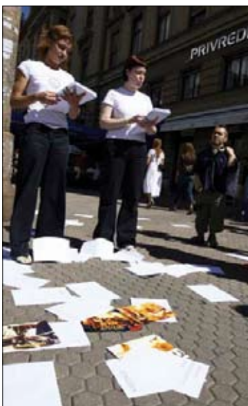
Protest na Cvjetnem trgu