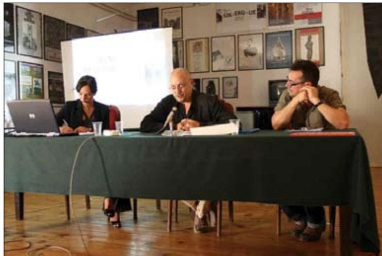
Konferenca na temo izginjanja javnega prostora

Otvoritev festivala je bila 8. septembra 2006 v Travnem na travniku, ki se nahaja na drugi strani Save, s piknikom za vse udeležence. Na notranjem zelenem dvorišču stanovanjskega objekta Mamutice je mesto s pomočjo politične oblasti brez upoštevanja želja prebivalcev začelo graditi cerkveni objekt. Zeleno igrišče so tako spremenili v gradbišče brez kakršnega koli vprašanja prebivalcev. Podobna urbana neskladja so odkrivali avtorji, ki so svoje projekte priredili potrebam in zahtevam lokacije. Namen letošnjega UrbanFestivala je bila predstavitev in uveljavitev umetniških projektov skozi aktivno delovanje v prostoru mesta. Aplikacija intervencij je med 8. in 15. septembrom 2006 odpirala alternativo za delovanje obstoječih ur-