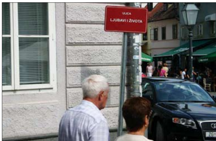
Preimenovanje ulic