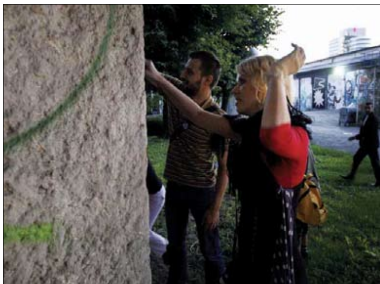
Akcija ob Čakalnici zavzetja pri Francoskem paviljonu