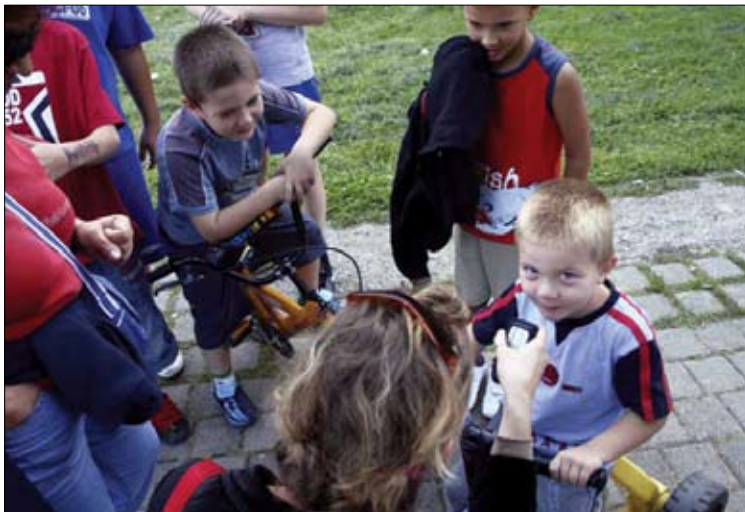
Intervjuji s prebivalci Mamutice

Dvodnevna konferenca z naslovom Javni prostor v menjavi se je odvila pred samo otvoritvijo UrbanFestivala. Skozi tri tematske bloke se je obravnavalo pomen izginjanja javnega prostora, pozicioniranje vloge javne skulpture v prostoru in analizo modelov in pristopov sodelovanja med različnimi strokovnjaki in javnostjo. Na konferenci so svoje poglede na problematiko izginjanja javnega podali arhitekti, urbanisti, umetnostni zgodovinarji, urbani antropologi, psihoanalitiki, teologi, umetniki, politiki in investitorji posameznih objektov.