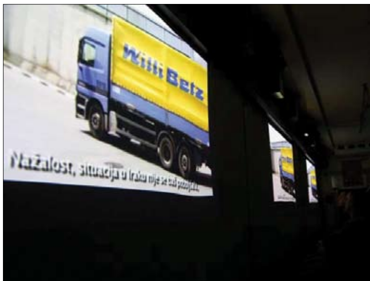
Projekcija Cargo Sofije