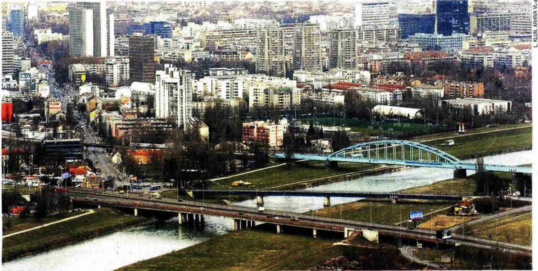
Gračani žele da Sava i dalje bude mjesto za rekreaciju